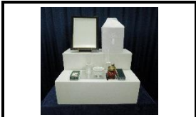
後飾り祭壇・仏具